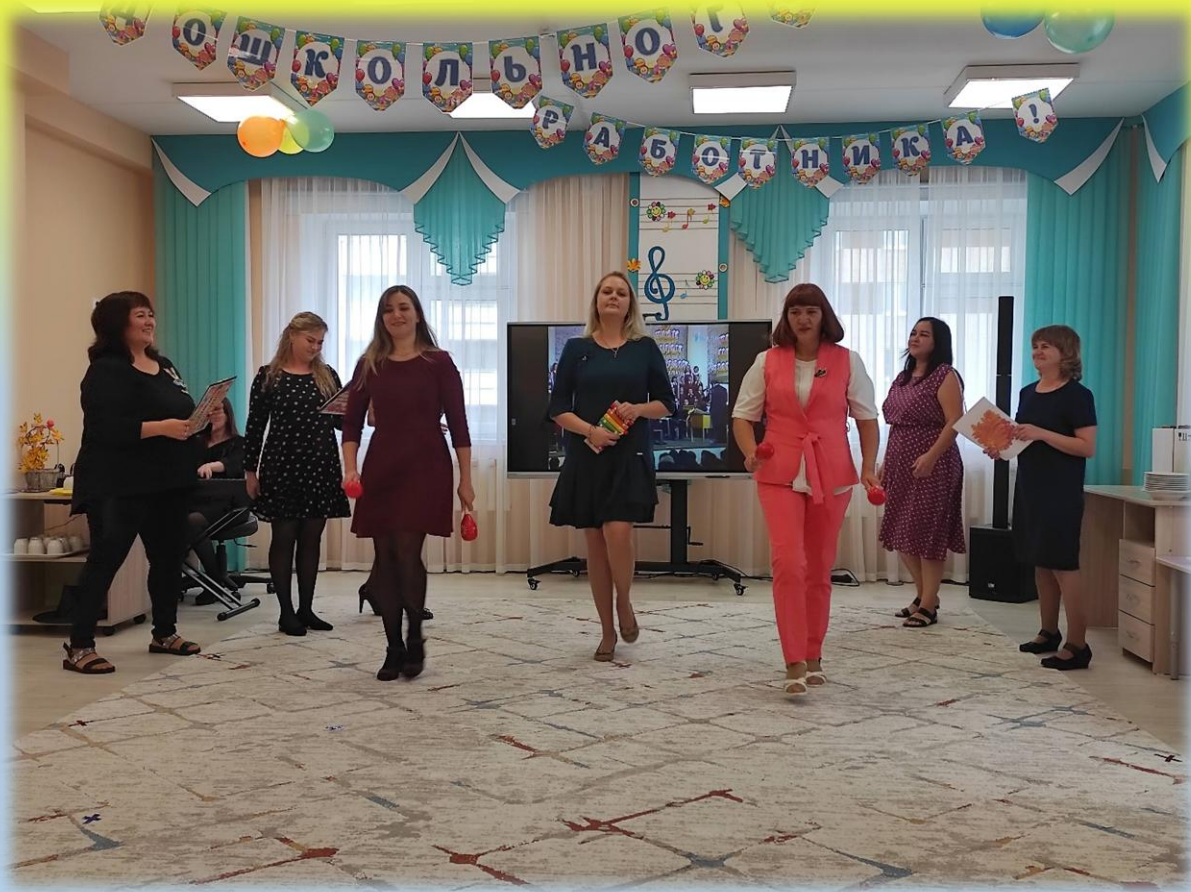
День дошкольного работника

- участие педагогов в традиционных праздниках;