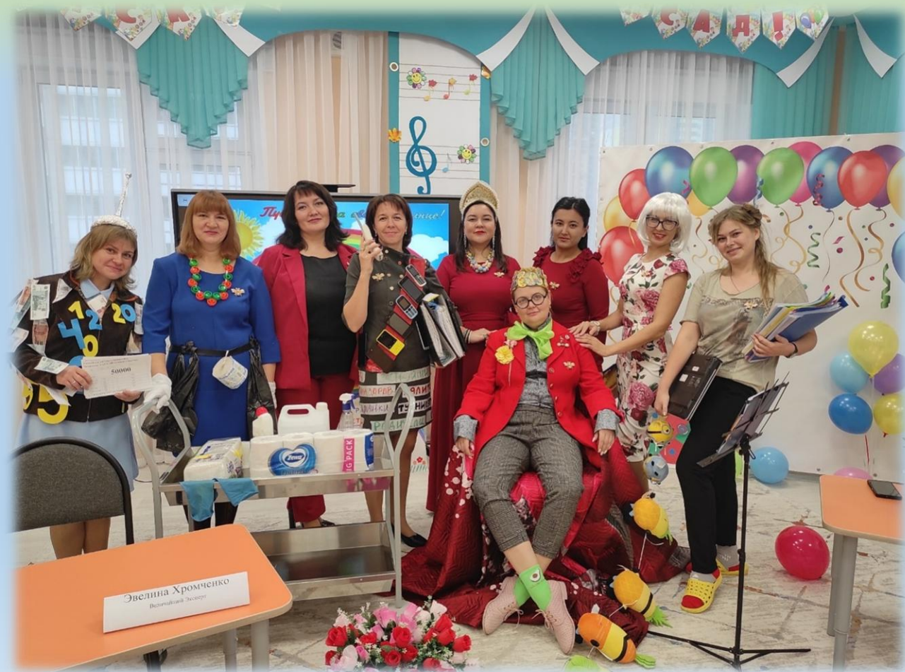
День рождения детского сада